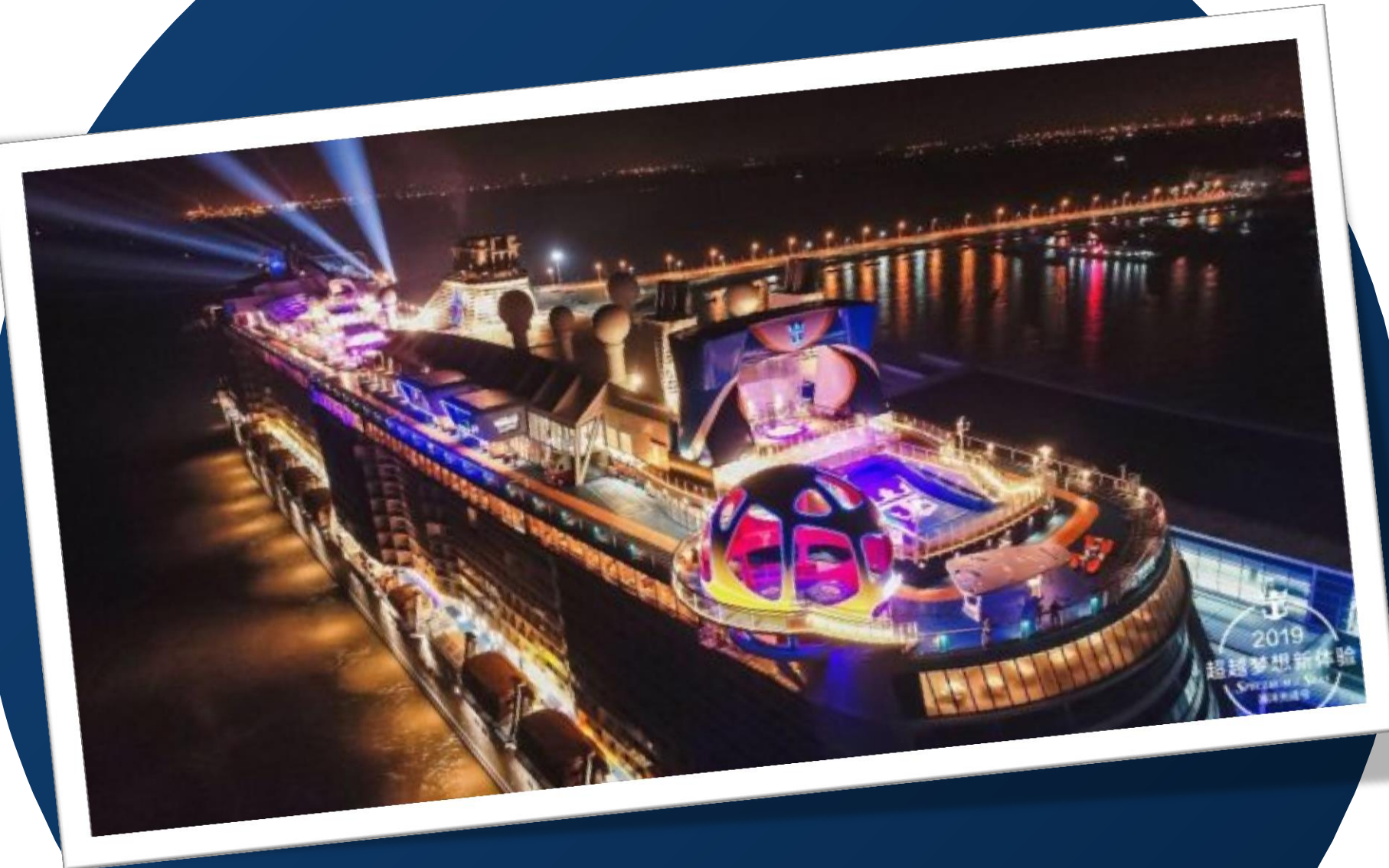
Spectrum of the Seas