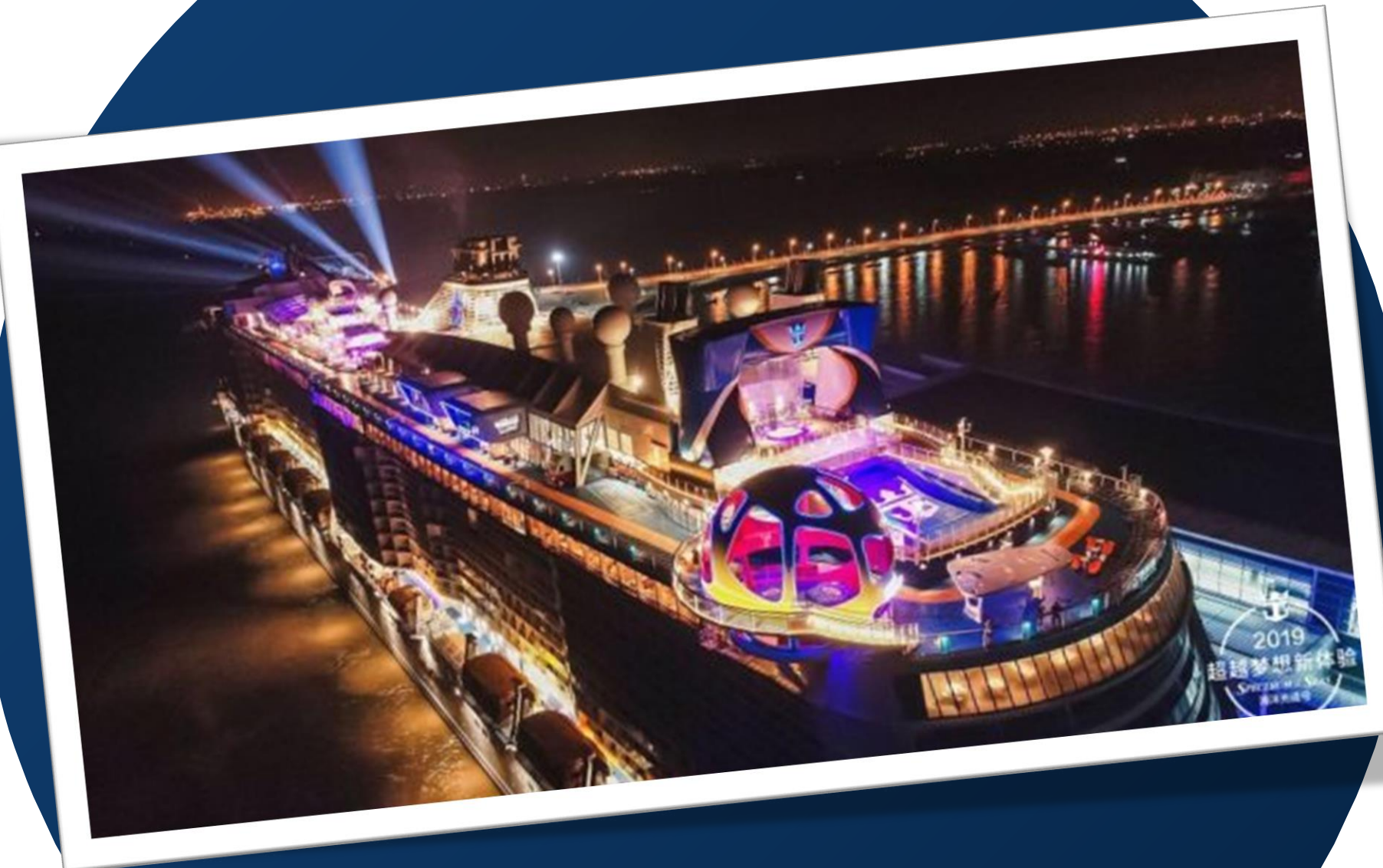
Spectrum of the Seas