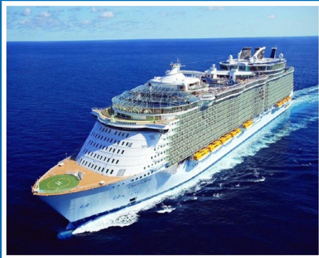
OASIS OF THE SEAS