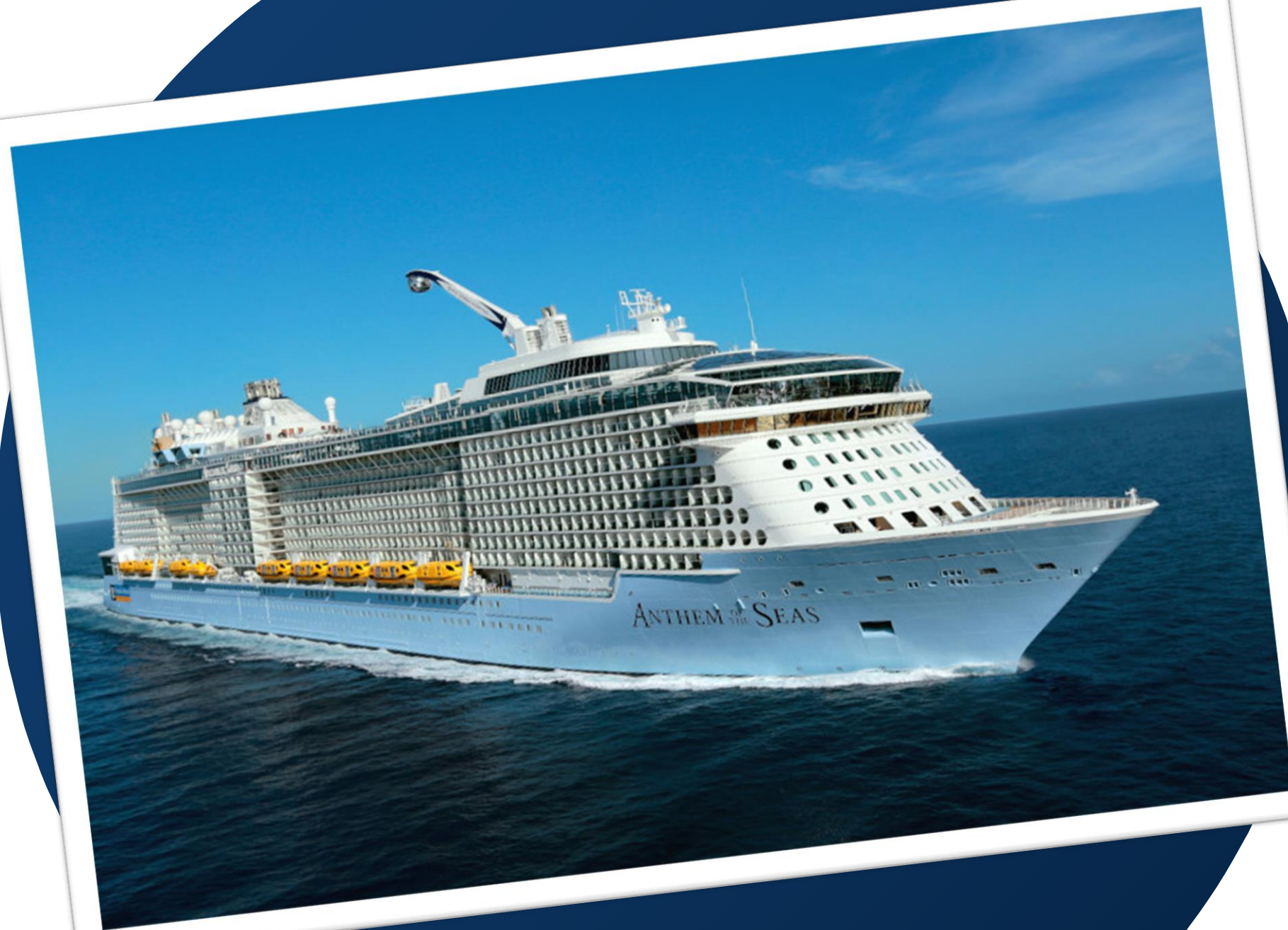
Anthem of the Seas